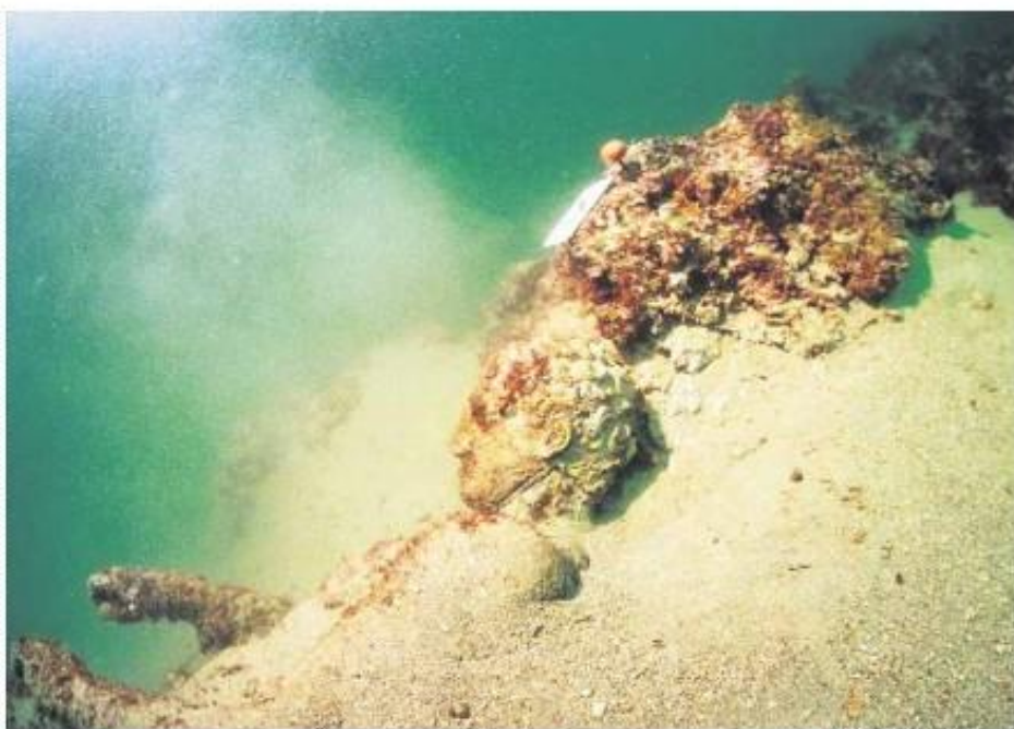
2000 let na dnu morja ▲

Potem se je začelo dogajati, tudi s senzacijami. Ko je oblast zavarovala najdišče in naredila program projekta, je aprila 1999 štirinajst potapljačev ekipe - ki so jo sestavili ministristvo za kulturo, strokovnjaki zadrskega arheološkega muzeja, sodelovali pa so tudi potapljači specialne policije in strokovnjaki za podvodna dela iz Malega Lošinja - pazljivo dvignilo kip, ki je v morju ležal, kot se je pokazalo pozneje, dve tisočletji. Po dvignu so z ožmi in detektorji raziskali še 10.000 kvadratnih metrov okolice najdbe, z robotskimi sondami pa še 50.000 kvadratnih metrov tamkajšnjega podmorja. Razen svinčeni h prečk starorimskega sidra, odlomkov amfore iz drugega stoletja po Kristusu in podnožja najdenega kipa niso našli ničesar, čeprav so pričakovali ostanke brodoloma. Domnevajo, da so mornarji z rimske ladje, ki je bila morda namenjena v Oglej, Raveno ali Istro, kjer je bilo kar nekaj