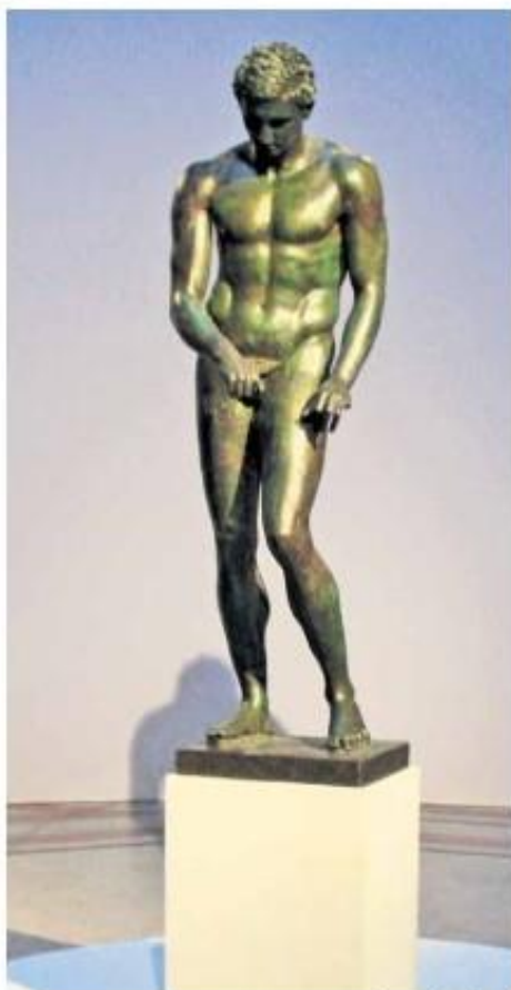
Lepota in moč ▲

bogatih rimskih vil, v viharju pometali v morje del tovara, tudi bronasti starogrški kip, čeprav so vedeli, da je dragocen. Razlaga se sliči nekoliko posiljena, napetosti zgodbe pa nikakor ne škoduje.